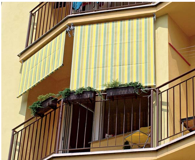
Vertikálna navíjacia markíza Separet chráni pred slnkom i dažďom, vystužená bočnými oceľovými lankami, tkanina Sattler s UV filtrom, široká ponuka farieb a vzorov, Markizy.sk