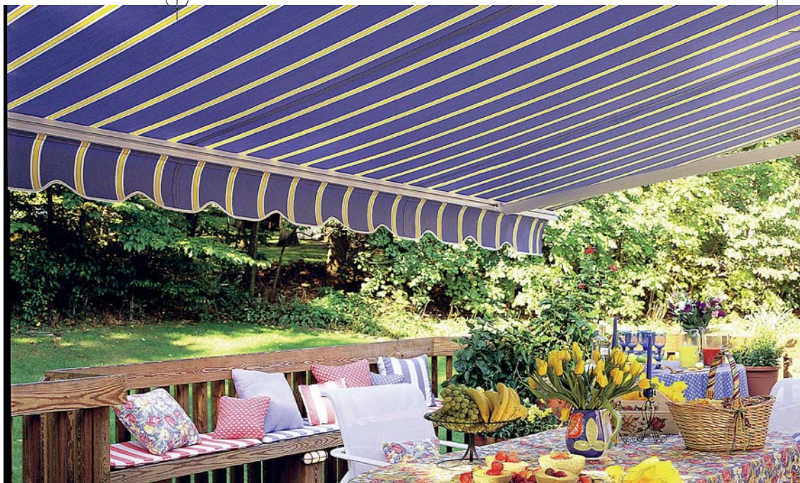
Terasová markíza s volánom, akrylová tkanina Sattler s impregnáciou proti vode, stálofarebná, odolná proti plesni, široká ponuka farieb a vzorov, K-system