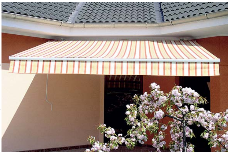
Monika KRÁLOVÁ, Foto: archiv firmy, profimedia.sk