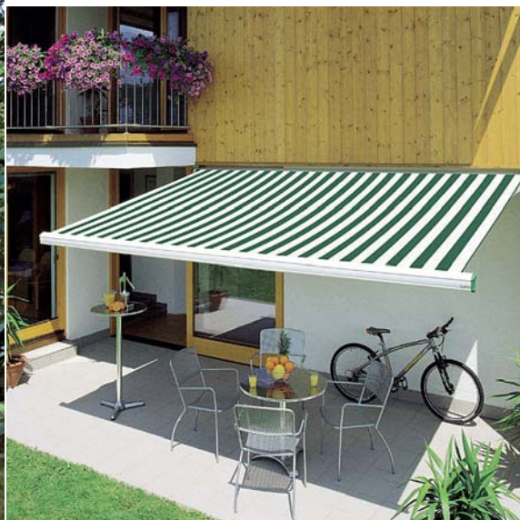
Terasová markíza Swingline s kazetou, ktorá chráni látku aj ramená. Nastaviteľný uhol sklonu, akrylová tkanina Sattler, K-system