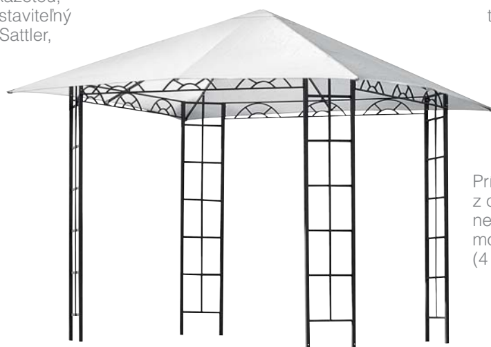
Prístrešok Roma, konštrukcia z ocelových rúrok, 3 x 3 x 2,6 m, nepremokavý potah, bočné steny možno zakúpiť osobitne, 149 € (4 488,77 Sk), predáva Jysk