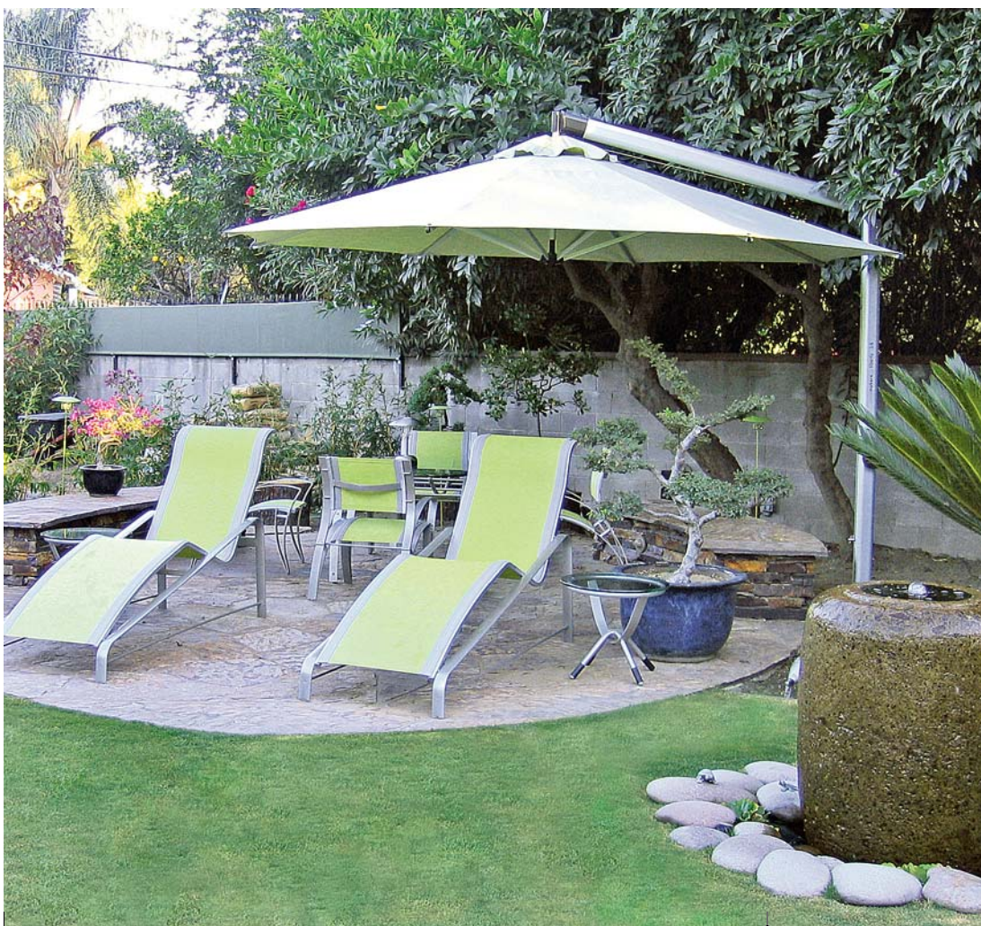
Slničník Shademakers vo vyhotovení štvorec alebo osemuholník, konštrukcia z eloxovaného hliníka, nepremokavá akrylová tkanina v rôznych farbách, cena od 741 € (22 323,37 Sk), vyrába Umbrosa, predáva egoé

sotva odhadnete. Preto sa pri odchode pre istotu postarajte o zvinutie a upevnenie tkaniny a nespoľiehajte sa na pekné počasie. To sa môže zmeniť nebezpečne rýchlo. Škody spôsobené vystavením príliš prudkému vetru sa ako reklamácia neuznávajú. Starosť o zvinutie plachty však môžete prenechať i veternému senzoru a elektromotoru.