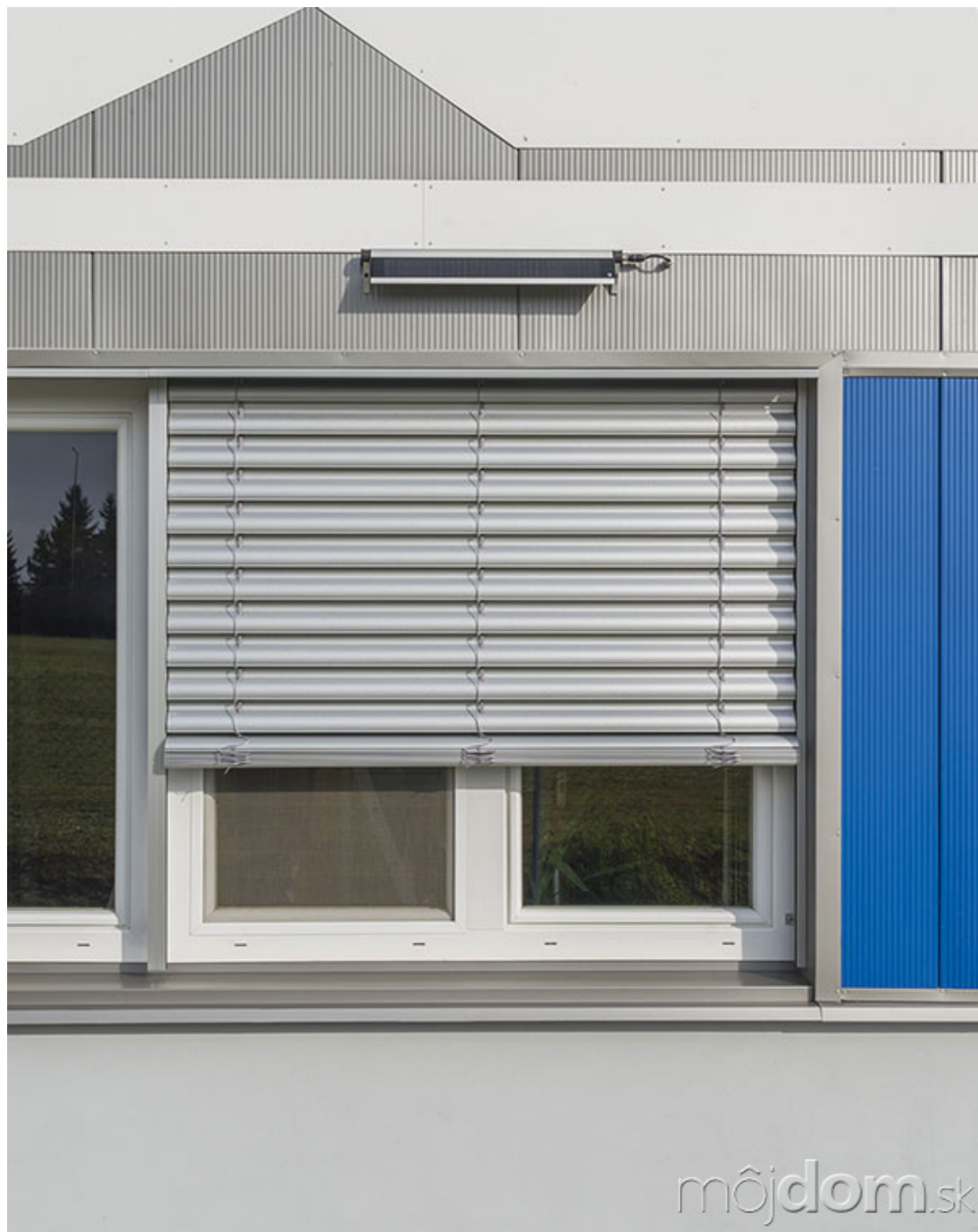
Solárny článok možno umiestniť na fasádu alebo priamo na krycí box žalúzie.