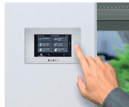
Nástenný vysielač MultiTec-touch.