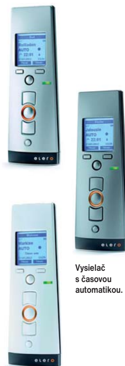
Vysielač s časovou automatikou.