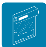
roleta s integrovanou sítkou proti hmyzu

Zcela ekologické a energeticky nejúspornější řešení pohonu pro rolety.