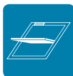
roleta pro střešní okna